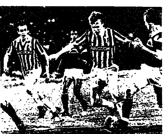
اللاعب البولوني زيبغنيو على وشك الانقضاض على مرمى بورود